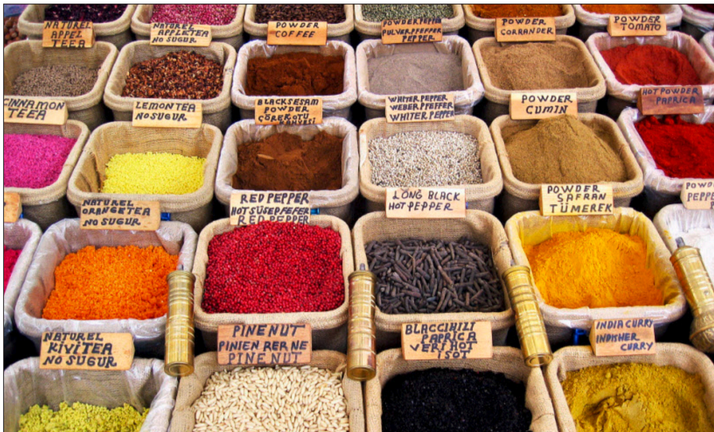
Globalisierung sei Dank: Heute sind auch Gewürze aus fernen Ländern in ihrer Originalrezeptur bei uns erhältlich und längst akzeptiert.

Sensorik. Trends. Schokolade zum Kaffee ist dank Multiplikation der Aromen ein Genuss, sagt die Sensorikerin. Eine Umfrage zeigt, dass Knoblauch mit Caramel harmonieren kann.