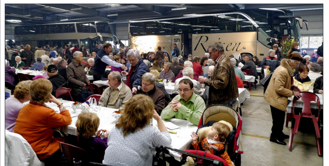
Der Tag der offenen Tür lockte gegen 2000 Besucher zur STI. Im Hintergrund rechts der neue Luxuscar. zvg

Zahlreiche Gäste besuchten die knapp 20 Minuten dauernden Vorträge über die bevorstehenden Reisen. Der älteste Reisebus des Fahrzeugparks – der 60jährige Saurer – lud zu Rundfahrten nach Steffisburg und Thun. Am Anlass konnten die jüngeren Gäste ihre ersten Reitversuche auf den Ponys im Areal der STI machen. Die Thunersee-Beatenberg-Niederhorn-Bahnen luden zum Trotti-Bike-Parcours ein und informierten über die Frühlingsaktion «4 aus 3». PD