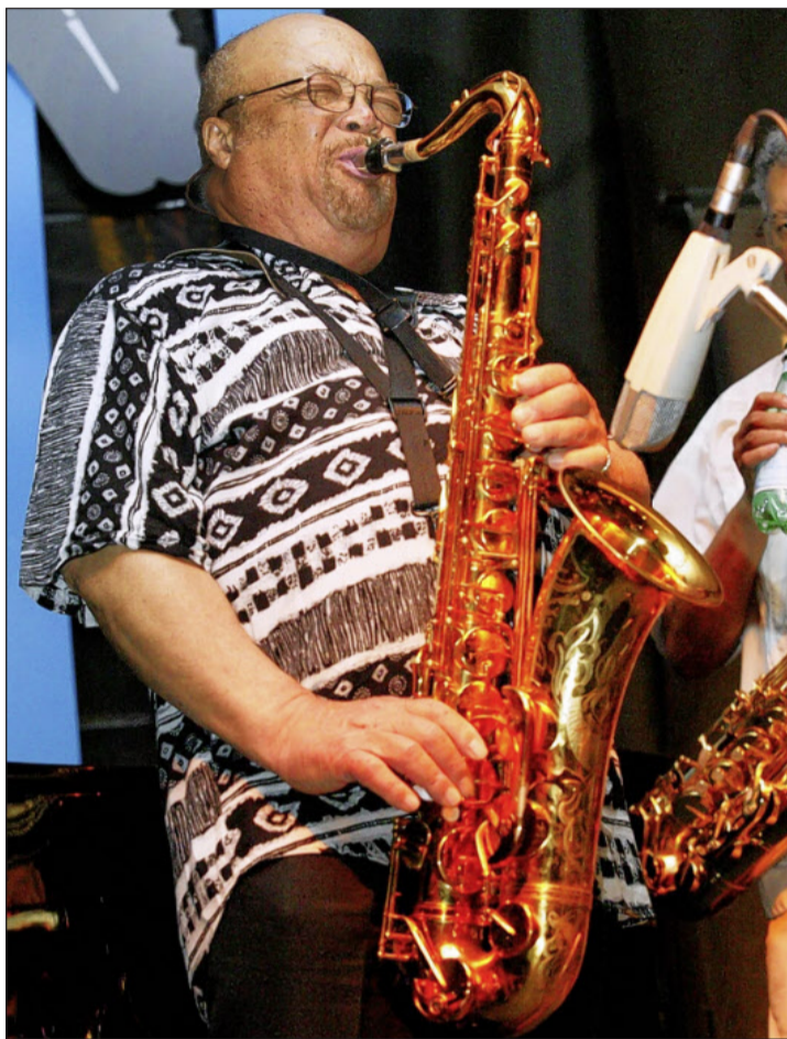
Der Saxofonist Red Holloway tritt im Thuner «Seepark» auf.

Wie kommt es, dass Sie in allen Stilrichtungen von Jazz über Blues bis R&B zu Hause sind?