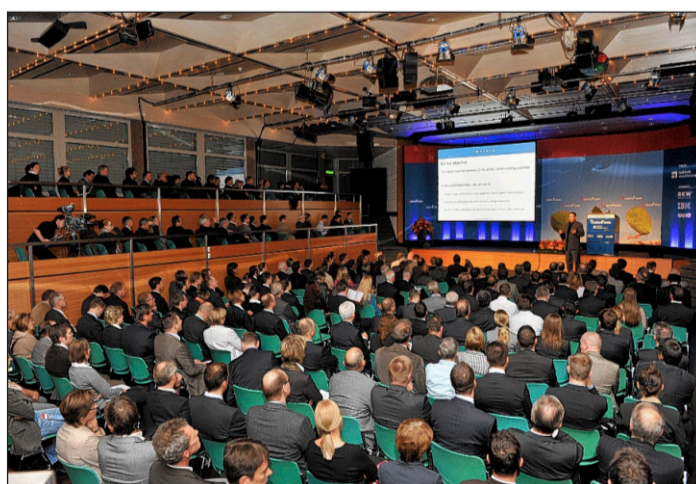
Am Climate-Forum im Hotel Seepark in Thun nahmen 450 Entscheidungsträger aus Wissenschaft, Politik und Wirtschaft teil.